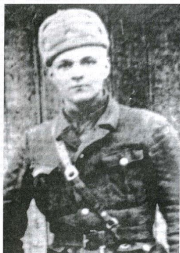
Солдат Юрий Бондарев. 1944 г.

В отличие от состоявшихся до войны писателей и поэтов, Юрий Бондарев - представитель той самой "лейтенантской прозы". Под Сталинградом он был командиром минометного расчета, был ранен и обморожен, и действие романа происходит тем декабрем 1942 года. Немцы пытаются прорвать кольцо окружения армии Паулюса, а Красная армия путём невероятного напряжения это наступление отбивает.